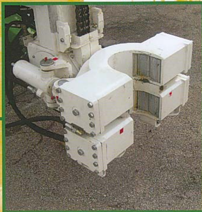
MORSA/SVITATORE CLAMP/BREAKER DOBLE MORDAZA