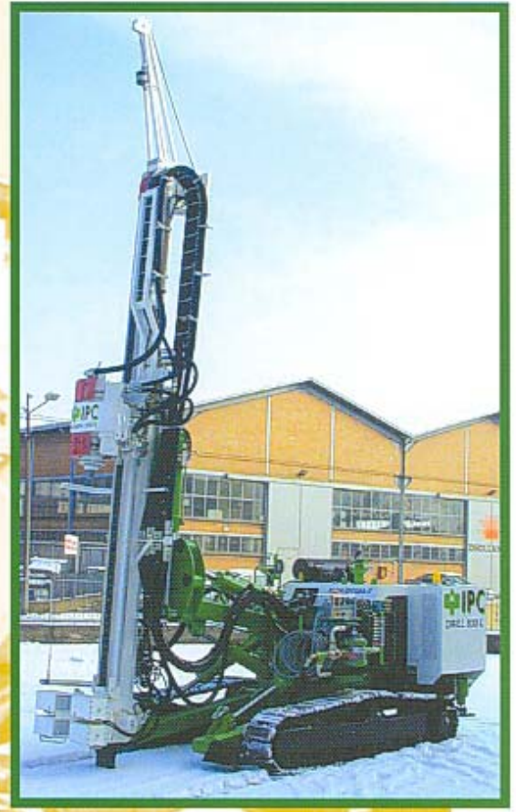
DRILL 830 L