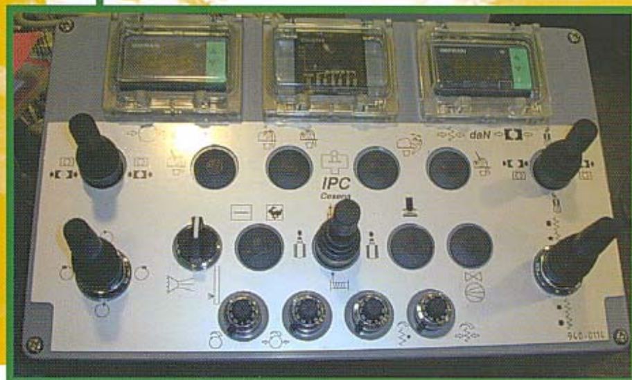
PLANCIA COMANDI REMOTE CONTROL PANEL DE MANDOS