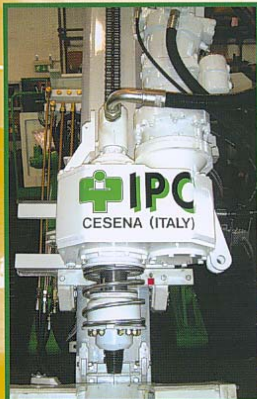
ROTARY ROTARY CABEZA DE ROTACION